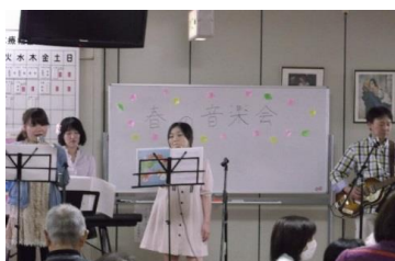
先生方の演奏に合わせて