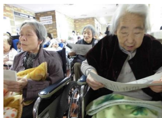
春の歌をたくさん歌いました。