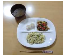
ピーマンは青椒肉絲に