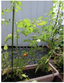
トマトはやっと色づき始めました

5月に植えた野菜が大きくなりました。 胡瓜とピーマンは成長が早く、皆さん待ちきれず夕食の一品としていただきました。