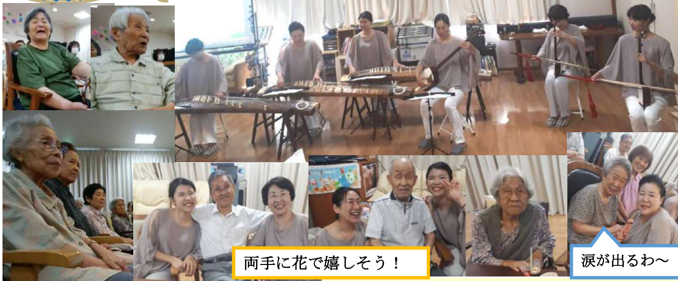
両手に花で嬉しそう！

箏・三味線・胡弓の美しい音色に癒されたり、一緒に歌って笑顔になったり、楽しい時間になりました。