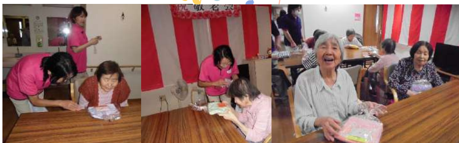
それぞれの顔写真付きの職員手作りメッセージカードと プレゼントをもらって笑顔がこぼれます。