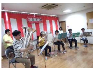
総社吹奏楽団の皆さん

9月15日に敬老会を行いました。今年は 総社吹奏楽団の皆さんが来てくださいました。 童謡では皆さんで歌ったり手をたたいたりしながら楽しみ、 懐かしい歌謡曲には涙を流される方もいました。