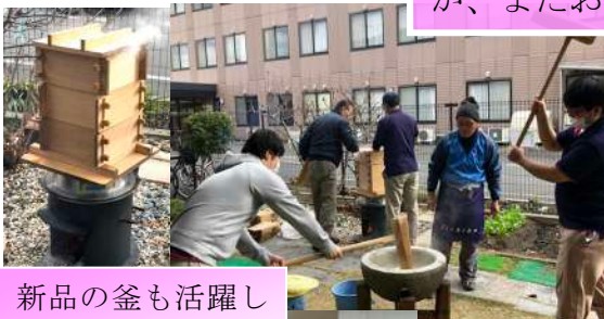
新品の釜も活躍しました。

恒例のお餅つき。「今年も最後の臼が一番上手にできたなあ」と笑いました。皆さんのたくさん丸めて下さったものが、またおやつで出ます。お楽しみに！