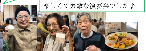
楽しくて素敵な演奏会でした♪