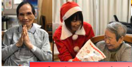
可愛いサンタからプレゼント